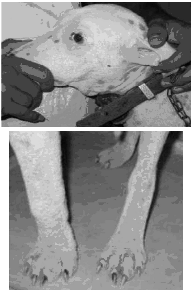
FIGURA 3. Avanzada remisión de la demodicosis en animales tratados, del grupo control (amitraz) y del grupo tres (ivermectina + tratamiento complementario), en la novena semana post tratamiento. / Advanced remission of demodicosis in treated animals of control group (amitraz) and group three (ivermectina + complementary treatment), in ninth week post treatment.

avanzada de la enfermedad (Figuras 3); no siendo así para el grupo dos que difiere del grupo control y del grupo tres (Tabla 1).