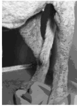
FIGURA 1. Cuadro clínico del grupo control afectado por demodicosis y tratados con amitraz, en la tercera semana./ Clinical square of the control group affected by demodicosis and treated by amitraz, in the third week.