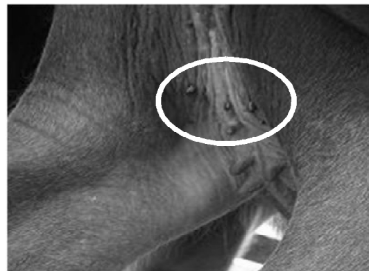
FIGURA 2. Rhipicephalus (Boophilus) microplus (Canestrini, 1887) en la región perineal de una añoja./ Rhipicephalus (Boophilus) microplus (Canestrini, 1887) in perineal area from young buffalo cow.