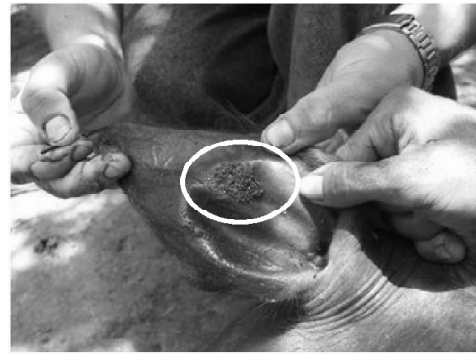
FIGURA 1. Rhipicephalus (Boophilus) microplus (Canestrini, 1887) en pabellón auricular de un bucerro./ Rhipicephalus (Boophilus) microplus (Canestrini, 1887) in auricular area from bucerro.

El hecho de haber encontrado, en muy pocos casos, ejemplares de la garrapata en búfalos adultos y que los bucerros se infesten en la zonas donde la